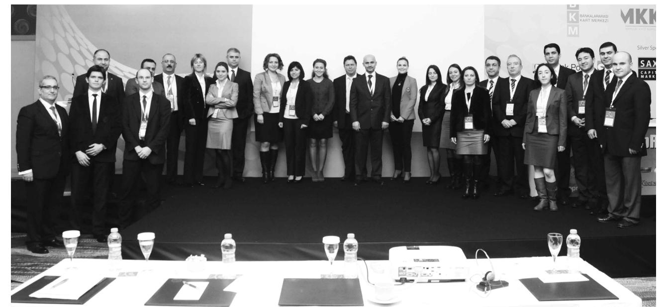
Toplantıda, Hazine Müsteşarlığı, Bankacılık Düzenleme ve Denetleme Kurumu, Merkezi Kayıt Kuruluşu, Bankalararası Kart Merkezi, Kredi Kayıt Bürosu gibi kurumlar ile banka ve sigorta kuruluşları, bağımsız denetim kuruluşları, bilişim firmaları ve akademisyenler çok değerli sunumlar gerçekleştirdiler